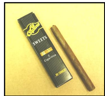
↑ Cigarillos « Al Capone »

Enfin, la perception générale des cigarillos était qu'ils sont plus populaires et plus socialement acceptables, et qu'ils évoquent un certain style de vie (« image ») lié aux arômes et à la relaxation.