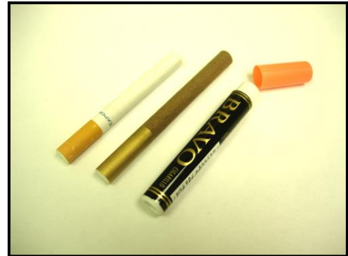
↑ Une cigarette à côté d'un cigarillo et son emballage.

Les cigarillos représentent un problème particulier en ce qui concerne le tabagisme chez les jeunes. Leurs caractéristiques ainsi que leur plus grande accessibilité les rendent particulièrement attrayants pour les jeunes, et risquent d'encourager davantage l'expérimentation du tabagisme chez certains enfants, adolescents et jeunes adultes.