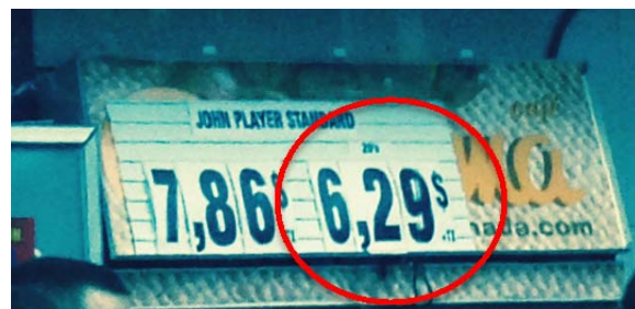
Prix affiché dans un dépanneur de Montréal le 5 novembre

Depuis un certain temps, la Coalition et les principaux groupes de santé du pays ont critiqué la stratégie de diversification des prix déployée par les fabricants du tabac depuis 2002. xiv Cette manœuvre leur permet de créer une segmentation du marché en fonction du prix, soit un éventail de marques xv allant des catégories « économique » à « haut de gamme ». Ainsi, en réduisant le prix de détail de certaines marques suite à une hausse de taxes, l'industrie peut minimiser l'impact de celle-ci en continuant à offrir des cigarettes à très bas prix. « C'est à cause de cette stratégie de diversification des prix qu'on trouve encore au Québec plusieurs marques de cigarettes qui coûtent entre 6 et 7 $ le paquet, malgré les récentes hausses de taxes, » conclut Dre Bois .