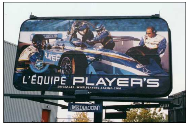
↑ Nouvelles affiches « CART » dans les points de ventes ↑ Ancien babillard Équipe Player's

Bien que l'industrie ait retiré ses anciens panneaux publicitaires, elle a remplacé ceux dans les points de vente avec des panneaux de publicité pro-tabac déguisée. Les nouvelles affiches reprennent les mêmes campagnes comme la Série Sports extrêmes de Export 'A' et l'Équipe Player's , sans toutefois nommer la marque de cigarette. Elles comportent les mêmes couleurs, images et activités associées aux marques de tabac par le biais des campagnes analogues apparaissant dans d'autres voies publicitaires permises. Elles sont placardées aux mêmes endroits où se retrouvaient les anciennes annonces, notamment là où l'on vend des cigarettes.