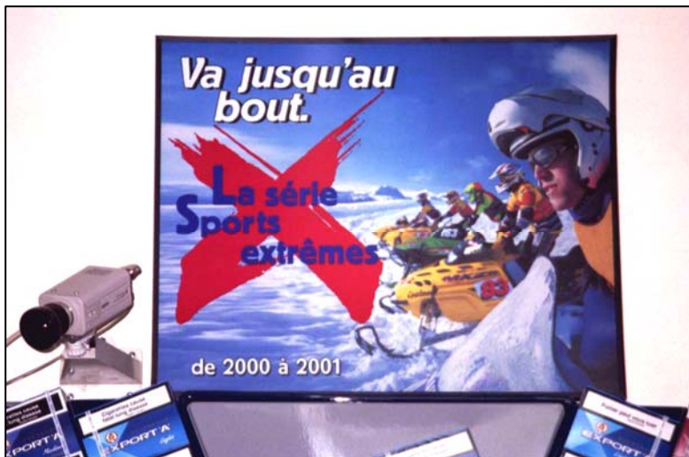
↑ Nouvelle publicité indirecte dans les points de ventes