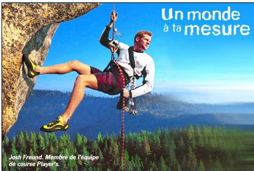
Écran d'accueil pour le site Internet de l'Équipe Player's