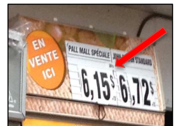
Prix d'un paquet de cigarettes à Montréal (mars 2016)

En d'autres mots, les populations les plus sensibles aux prix (soit les jeunes et les personnes à faible revenu) se voient privées des impacts bénéfiques de cette mesure de santé publique, augmentant davantage les inégalités sociales en matière de santé . « Si nous voulons bénéficier du plein potentiel dissuasif des taxes sur le tabac, il ne suffit plus de procéder comme avant. Nous invitons donc le gouvernement à examiner de nouvelles options législatives afin d'empêcher les pratiques de l'industrie qui neutralisent l'effet bénéfique des taxes sur les produits du tabac. »