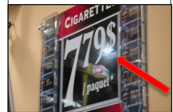
Prix d'un paquet de cigarettes à Montréal (janvier 2005)